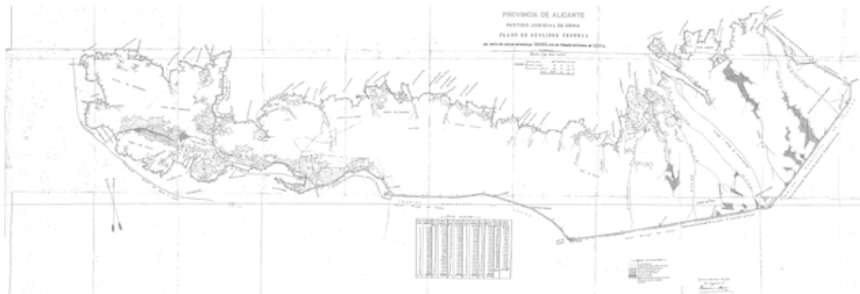
Figura 2: Plànol de la Partició de la Muntanya Pública de Dénia (1897)

Els Informes que acompanyen aquests mapes expliquen la metodologia emprada; així tenim que per a traçar els límits externs de la muntanya pública s'han considerat les fites amb zones agrícoles que han presentat títulos , i, «para evitar reclamaciones .../...los cultivos que parecen llevar en posesión más de 30 años», les parcel·les recents del perímetre del mapa s'han obviat per manca d'oficialitat. A més a més, els enclavats agrícoles recents sí s'han representat, però tampoc en tota la seua magnitud, ja que «en muchos de los enclavados no ha sido posible parcelar el terreno poseído», entre altres motius adueix manca de titulació, declaració dels ocupadors, incompareixença, etc. Llavors, els mapes estan oferint-nos una imatge errònia pel que fa a les rompudes recents, ja que no se'n cartografiaven totes. La representació de les rompudes antigues sembla que té més fiabilitat, per tant, els increments de les transformacions agrícoles recents que hem deduït adés serien, en realitat, encara majors.