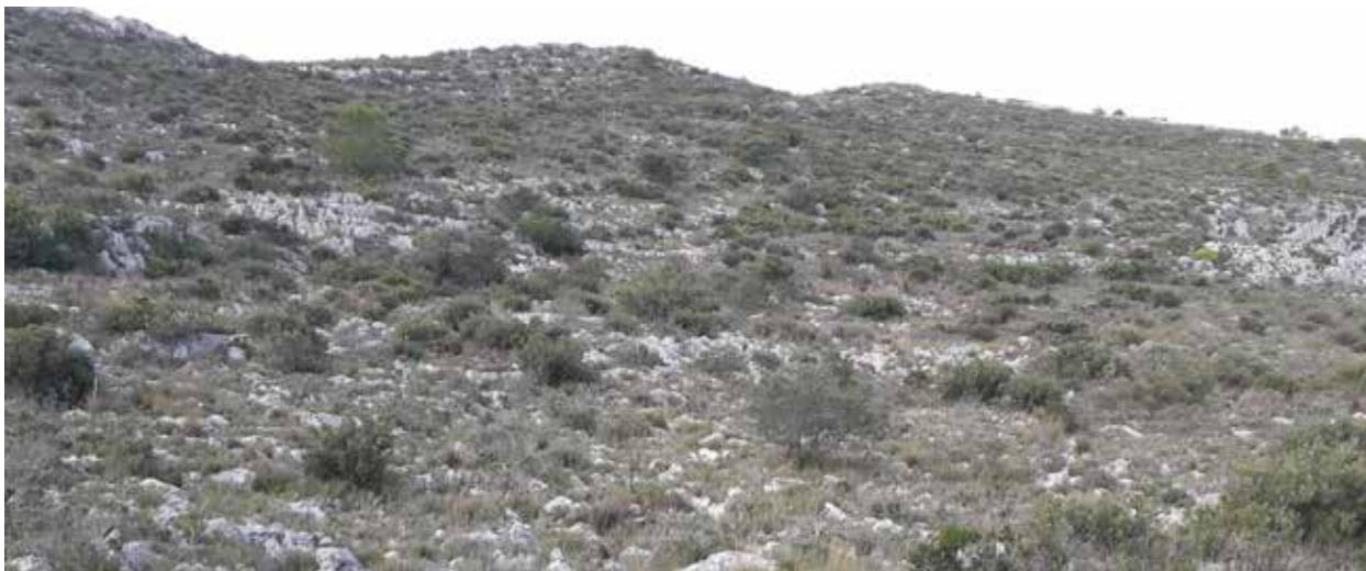
Figura 5: Àmbit sense abancalar en la plataforma superior del Montgó.

No passà el mateix a Xàbia, ja que el projecte de Colònia va quedar suspès. Un testimoni d'aquesta diferència podem extraure-la del mapa de la partició de la part de Xàbia del 1897 i que ja hem esmentat. Aquest mapa va ser reutilitzat per la Junta de Colonització el juny de 1920 com a mapa d'amollonament. En els 23 anys que transcorren entre l'un i l'altre, només s'afegeixen dues noves transformacions en la muntanya pública, una a mitjana altura en el barranc dels Garroferets i l'altra en la part alta del barranc del Migjorn; aquesta última d'unes dimensions considerables, prop de les 2 ha. Es podria dir que a la banda de Xàbia la crisi agrícola va fer que les rompudes es deturaren amb el canvi de segle, mentre que a Dénia la creació de la Colònia va forçar rompudes encara fins el 1920 que, no obstant, tingueren un recorregut ben curt, ja que la crisi feia 20 anys s'havia fet notar i a poc a poc es deixaren de treballar.