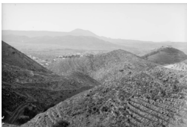
Figura 1: Foto presa entre 1927-1936. A la dreta, un tram de la carretera i l'ermita de sta. Llúcia; al fons, el Puig de la Llorença.

Quan un foraster puja per la carretera de les Planes, siga pel costat de Dénia o pel de Xàbia, se sorprén amb el paisatge de marges de pedra seca escampats pel relleu costerut i rocallós. A aquests bancalets se'ls han adjudicat autories diverses. A continuació tractarem d'aportar algunes dades sobre la datació i quantificació d'aquestes margenades al Montgó.