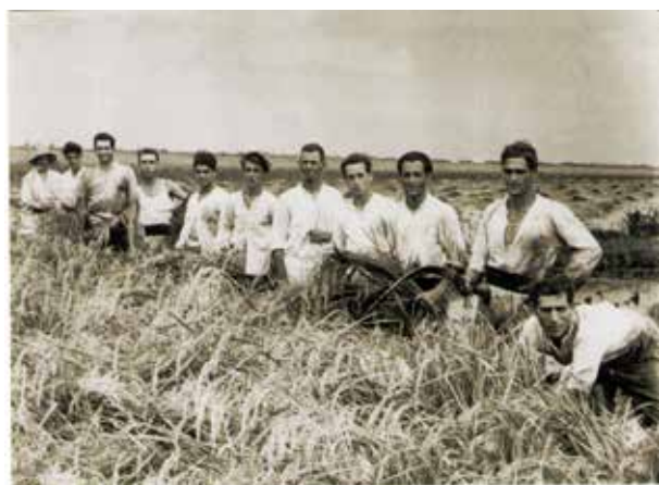
Escenes de diferents treballs del conreu de l'arròs.

“La marjal mai no va ser ni serà un espai d’hàbitat. La història social la van fer els homes al llarg del temps amb l’únic propòsit de traure-li profit agrícola i ramader. I sols en els errors comesos volent saber més que la natura és on hem de cercar el tarannà conflictiu de la marjal.”