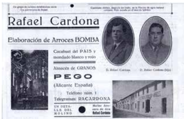
Publicitat d’una marca d’arròs de Pego a la premsa de primeries del s XX.