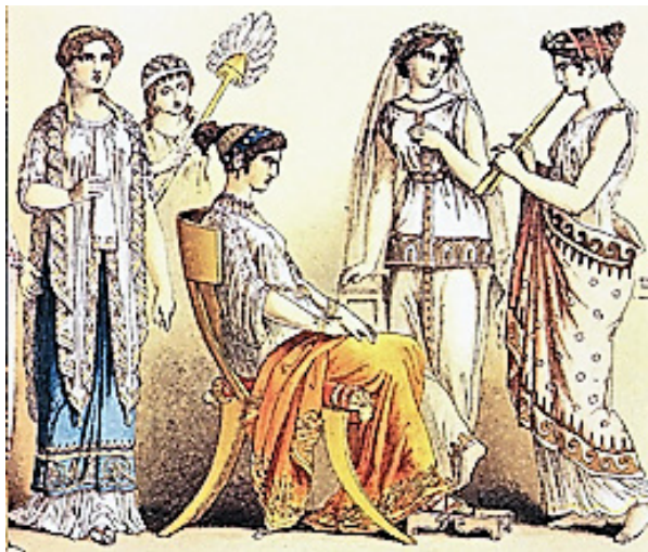
Dona menopàusica a l'antiguitat.

Hipòcrates esmenta la menopausa en els seus escrits, i Aristòtil (any 322 aC) descriu, en la Historia Animalium , el cessament de la menstruació al voltant dels cinquanta anys. Amb ell, coincideix Flavi Aeci d'Amida , general romà del segle VI, qui afegeix l'absència de la regla no abans dels trenta-cinc anys. Aèti d'Amidia (metge de Justinia ) i Pau d'Egina , en l'època