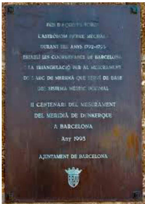
Placa commemorativa de la mesura de la latitud per Méchain al Castell de Montjuïc.

vèrtexs del triangles en una regió que encara no havia sigut cartografiada, posteriorment aniria en sentit contrari fent les corresponents mesures.