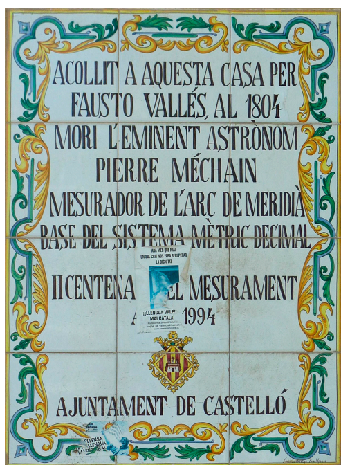
Placa en memòria de Méchain a Castelló.

“Estic exhaust, fins ara no he aconseguit cap èxit i la meua mala estrella, o més ben dit, la fatalitat que sembla vinculada a aquesta empresa, gairebé no em proporciona esperances per arribar a coronar-la feliçment. Tal vegada un savi més capaç, menys inepte i més afortunat que jo, pugui substituir-me”.