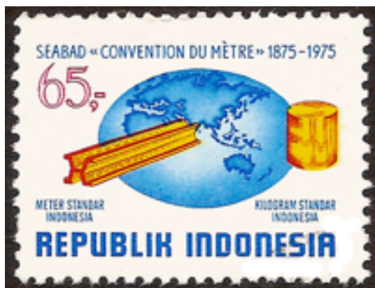
Metre i quilogram estàndards.

Méchain és rebut amb grans felicitacions com un heroi i és anomenat director de l'Observatori de París, màxim honor de l'astronomia francesa. Delambre i Méchain havien de presentar els resultats de l'expedició per tal que la Comissió els verificara, tres mesos després d'arribar a París encara no havien presentat les dades. El 2 febrer de 1799 Delambre presenta les dades dels seus triangles de Dunkerque a Rodez, les quals reben l'aprovació de la Comissió. Després de rebre un ultimàtum, el 22 de març Méchain presenta les seues dades. La Comissió queda meravellada i considera el seu treball com una obra mestra. Els càlculs es fan amb la latitud de Barcelona corresponent al Castell de Montjuic. Sols quedava reduir totes aquestes dades a un valor únic: el metre. En analitzar amb més detall les dades es descobreix que tots els meridians de la Terra no eren iguals, el meridià que passava per Greenwich no era el mateix que el que travessava París. S'havia enviat a Delambre i Méchain a mesurar el món partint d'un meridià que representara a tots els de la Terra i resulta que la Terra era massa irregular.