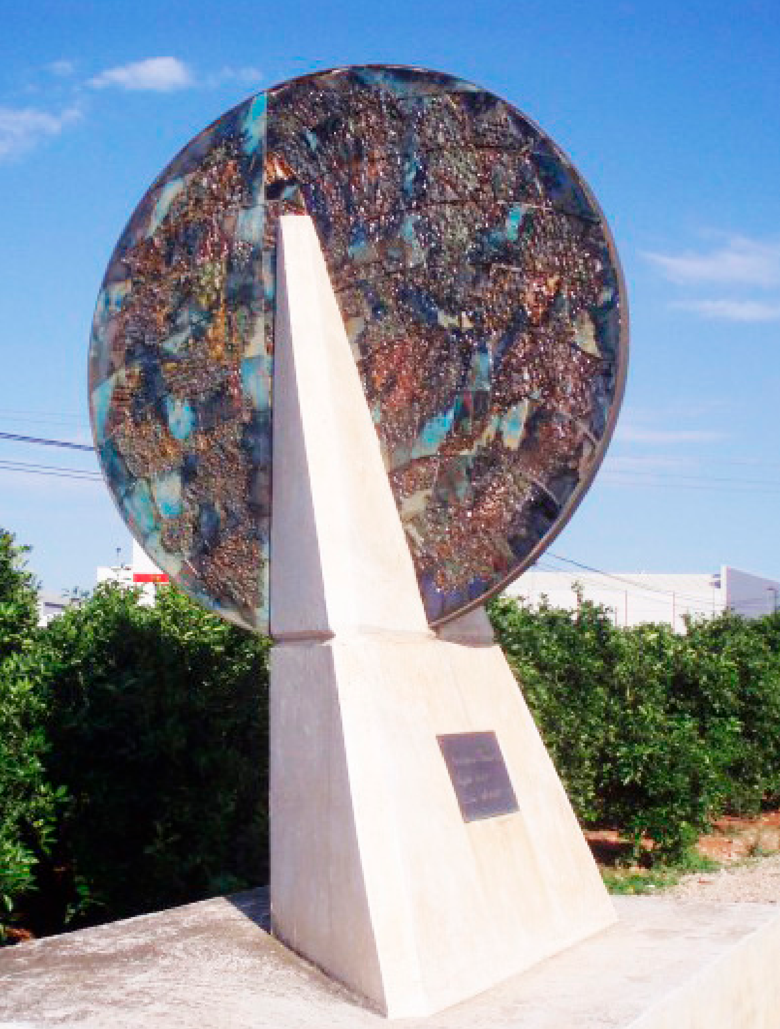
Monument (de discutit valor estètic) que marca el pas del meridià zero , a la carretera del Veger a Pego.