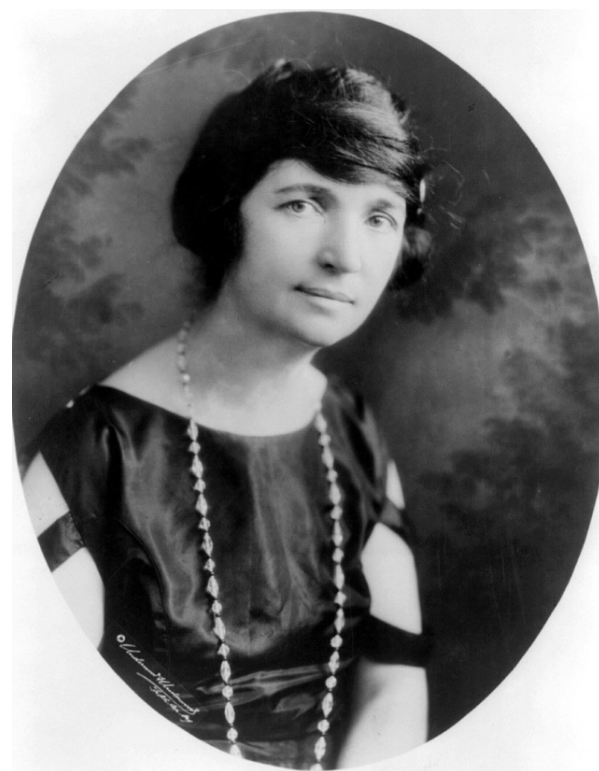
Matgaret Sanger, una de les fundadores de la IPPF al III Congrés de Mumbai

nacionalment la incorporació a la salut pública de l'avortament segur. Va ser fundada el 1952 a Mumbai, Índia. Més de 149 associacions que treballen en més de 189 països són actualment membres de la IPPF.