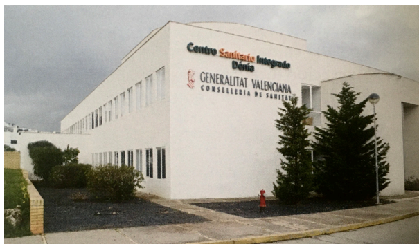
Centre Sanitari Integrat. Dènia

La Conselleria de Sanitat absorbí el Centre de Planificació Familiar i MTS de la Marina Alta i l'inclougué a la seua Cartera de Serveis dins del grup d'Unitats Especialitzades de Suport a l'Atenció Primària, depenent d'aquesta direcció però amb caràcter autònom. Quedaven integrats en la xarxa comarcal de Centres d'Atenció Primària.