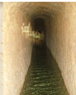
Cava o galeria subterrània.