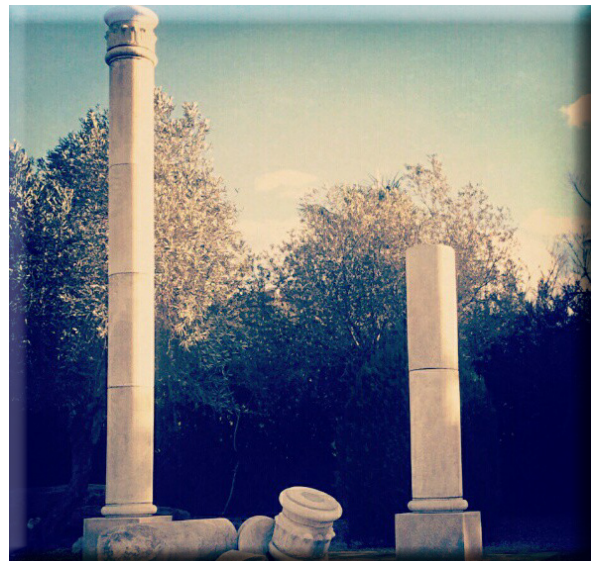
Diagrama de barres DANI TANASE