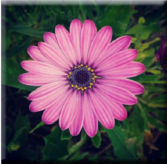
Simetria floral LAURA JOVER