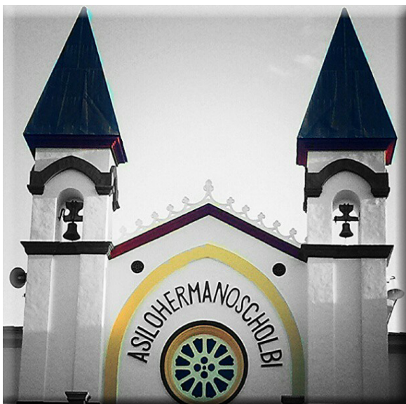
Tres triangles i un cercle DANI TANASE