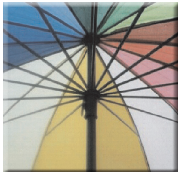
Angles i figures geomètriques FÀTIMA JARJOR