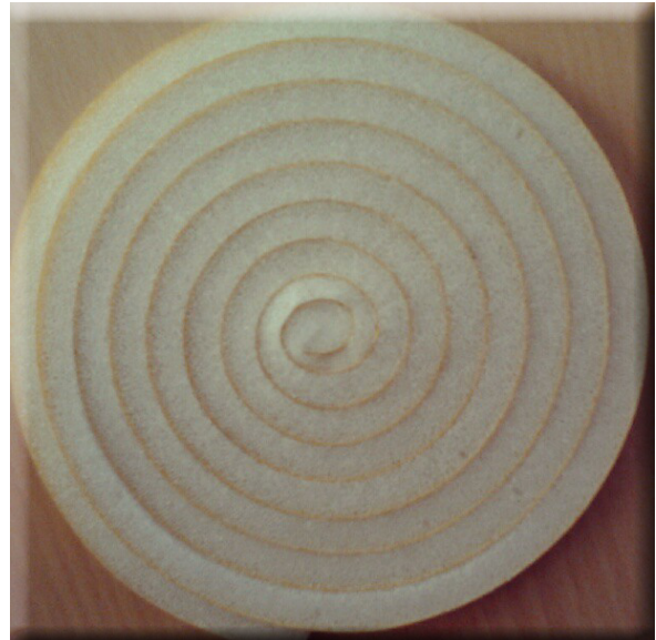
Espiral ALBA DEL CAZ