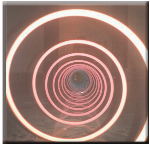
Espiral ANNA POLVOREDA