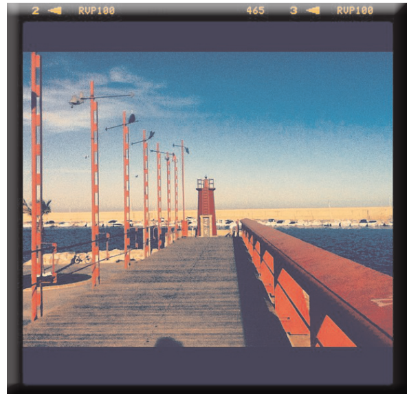
Línies paral·leles XANTHE DAMAA