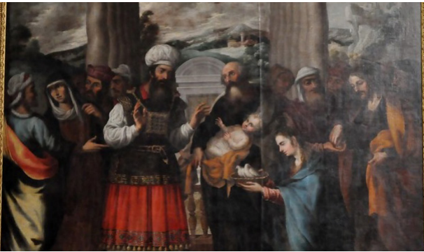
Presentació de Jesús en el Temple. Església de l'Assumpció. Biar.

Al llarg de les èpoques, el nombre de dies d'aïllament ha anat variant, com hem pogut comprovar tant en el verset del Levític com en l'obra de Boccaccio. Però també en més llocs i situacions.