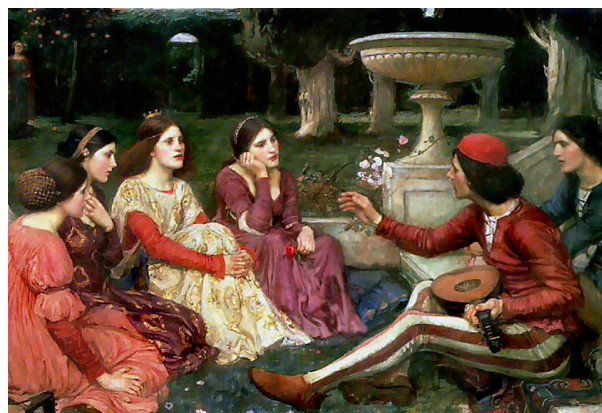
A Tale from the Decameron (1916), de John William Waterhouse. Lady Lever Art Gallery (Liverpool)

Històricament, l'aïllament de malalts per a evitar els contagis de malalties infeccioses 6 té antecedents tan antics com el Levític bíblic (13:4-6): «Ara bé, si a la pell hi ha una taca blanquinosa però no s'hi veu cap cavitat ni el pèl s'ha esblanqueït, el sacerdot aïllarà el malalt durant set dies. 5. El dia setè el tornarà a examinar. Si el sacerdot constata