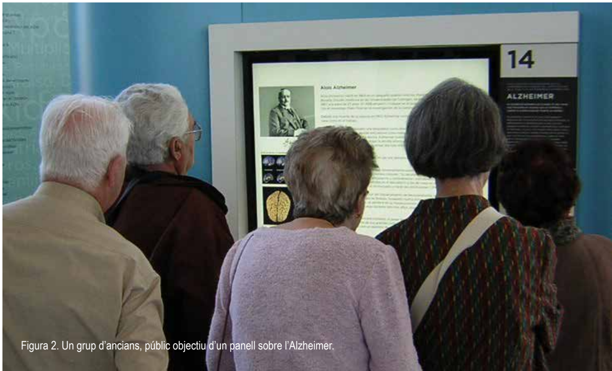
Figura 2. Un grup d'ancians, públic objectiu d'un panell sobre l'Alzheimer.

L'altra anotació és d'índole legal. “Museu” és també un concepte jurídic recollit en la legislació de gairebé tots els països. Un museu no deixa