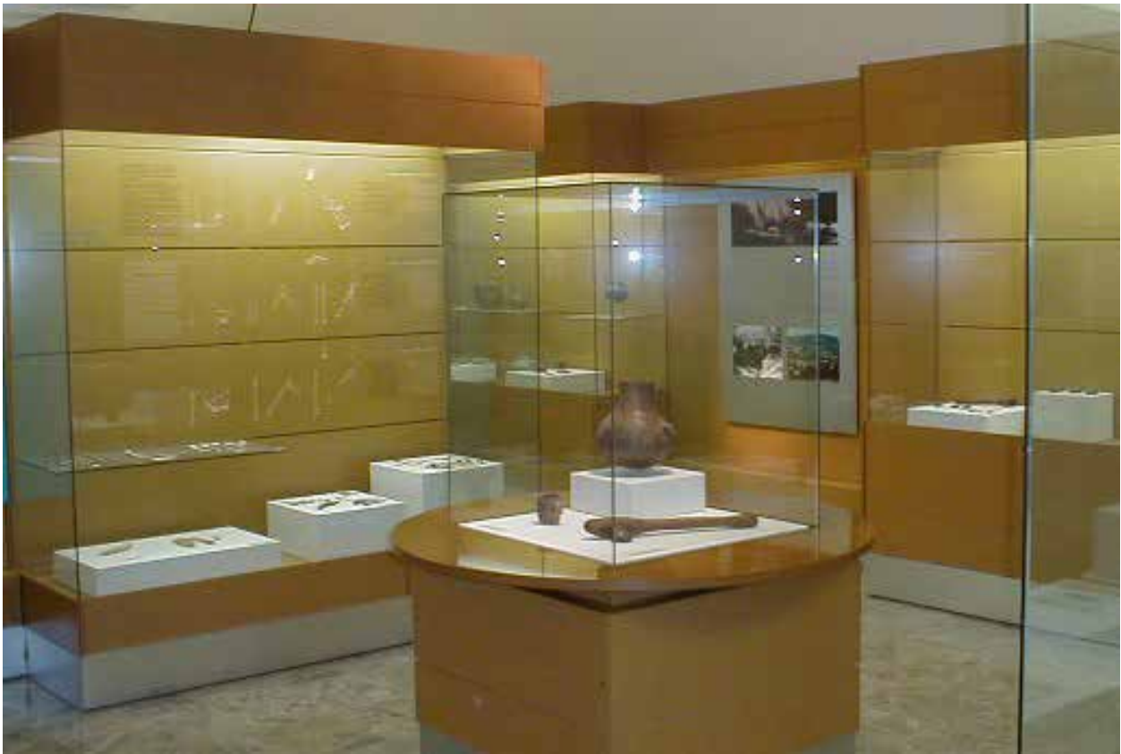
Figura 3. Un "Magatzem" que conserva bé.

exposicions temporals o tots dos; o si fomenta la diversitat, la sostenibilitat o la inclusivitat, va canviant amb el temps i al ritme de la societat i se li pot anar afegint en cada cas. No és essencial per a definir "museu" en el segle XXI i l'ICOM, els seus membres, i moltes empreses de museografia, haurien de superar els seus vells interessos, ancorats, explícitament o implícitament, en l'objecte museable i en els seus llocs de treball. Això ja ho apuntava bé Gary Edson, membre del Consell Executiu de l'ICOM, en la definició que proposava en el silenci debat de 2003 i en els seus "huit suggeriments", i per això es va muntar el desgavell. Rellegesquen-ho amb cura.