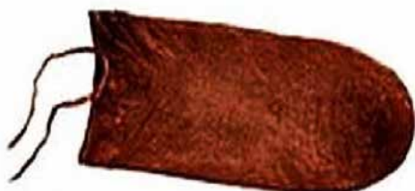
Condó de tela

Una hipòtesi sobre l'origen del nom de condó apunta a la paraula persa kendu o kondu que podria significar "vas llarg per emmagatzematge".