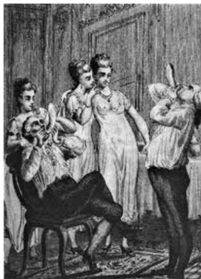
Comprovant l'estat del condó (Memòries de Casanova)

s'acompanyava amb un manual d'instruccions per al seu ús on s'aconsellava banyar-lo en llet templada abans de fer-lo servir en les relacions sexuals amb prostitutes. A Espanya, s'han trobat condons amagats entre els fulls d'un llibre de Medicina de la Biblioteca General Històrica de la Universitat de Salamanca. Embolicats en un full de diari, pot ser, per un estudiant d'aleshores que consultava un manual de medicina.