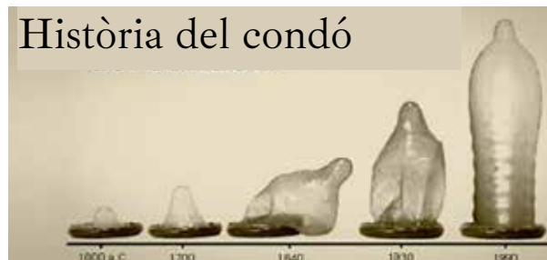
Evolució del material de què està fet el condó: Lli Budell Goma Làtex Làtex + làser