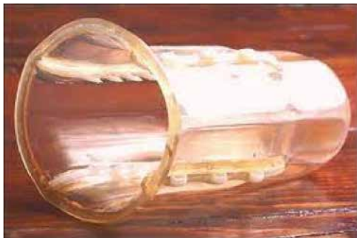
Condó contra violadors