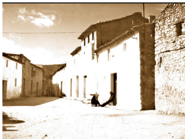
Orbeta a finals dels anys 60.