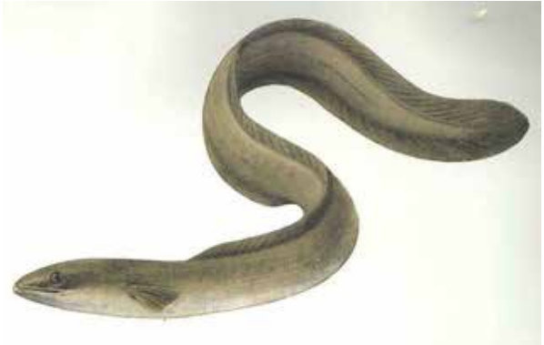
Anguilla vulgaris .

La clau del misteri començava a perfilar-se, però lluny dels rius europeus. Ja el 1856, un biòleg alemany havia capturat a l'estret de Messina una criatura diminuta, transparent i aplanada,